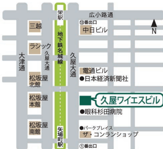
▼久屋ワイエスビル